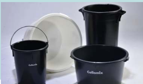
• Mischeimer •