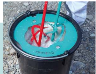
• Set de limpieza MixerClean •