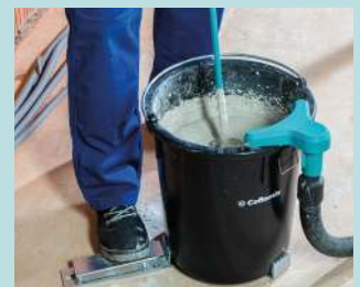
• Soporte para cubos mix. GRIP •